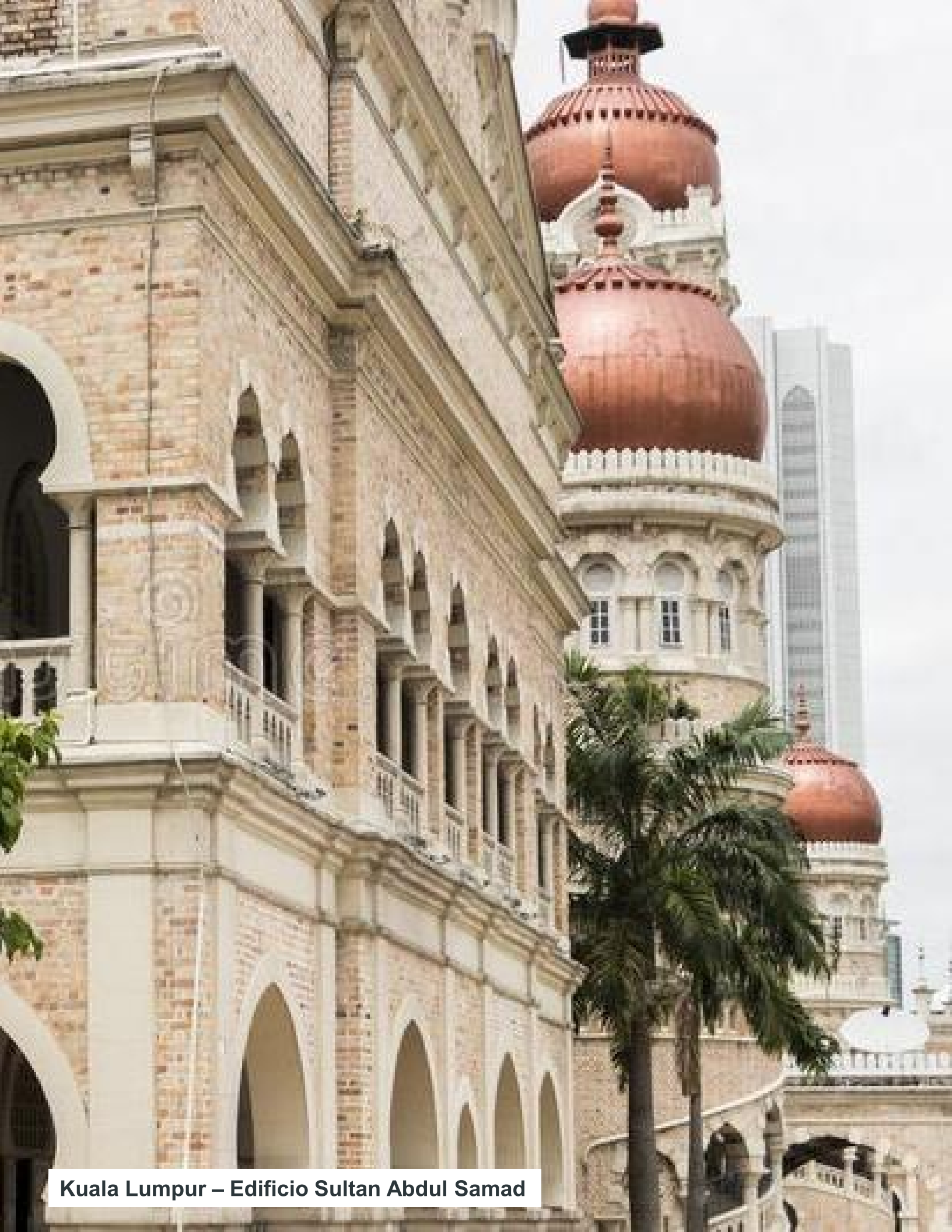
Kuala Lumpur – Edificio Sultan Abdul Samad